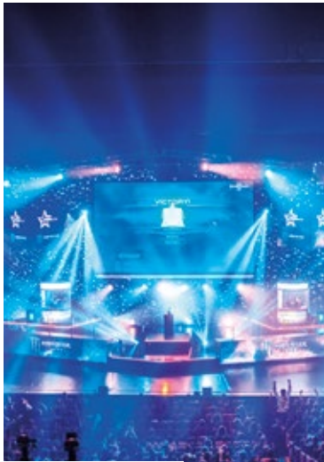
Cadeaux de Noël